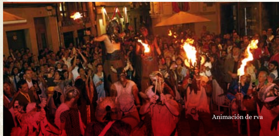
Animación de rva

Fondo da Pr. Maior Actividades atrimv vestae 14:00 h. Vnha nova Svma Vestal 20:30 h. Acto final das lexións romanas e tribvs castrexas 22:00 h. Apagado do lume sagrado do arde lvcvs