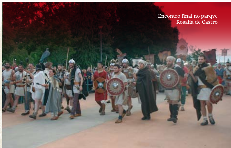
Encontro final no parque Rosalía de Castro

13:25 h. Fondo Pr. Maior (polas rvas da cidade) Os favnos de Drako